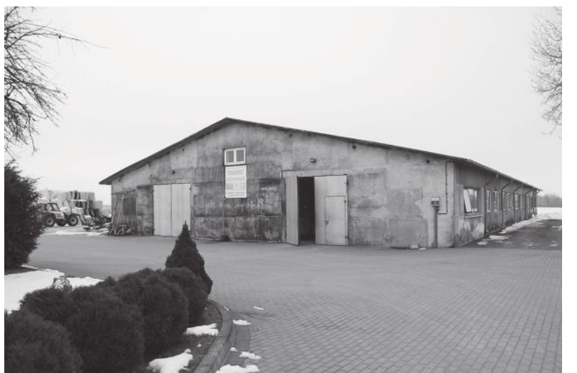
Į ūkinius pastatus gali nueiti trinkelėmis grįstu kiemu įsispyręs į šlepetes.