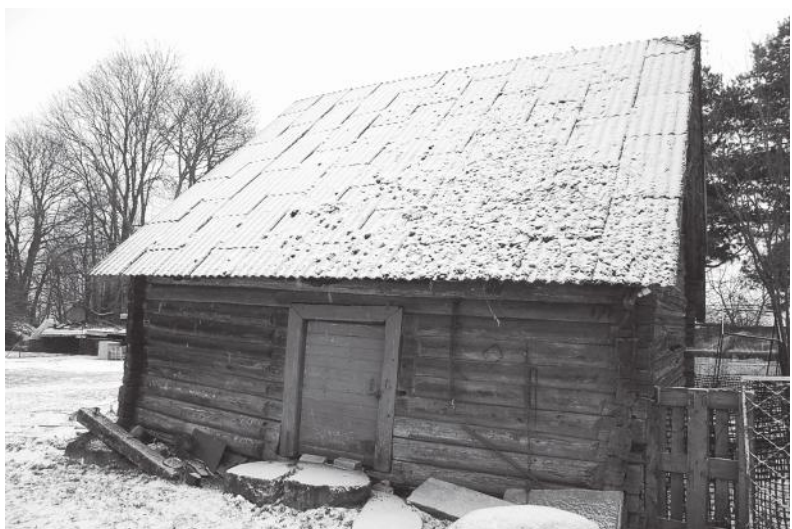
Šiam seniui svirnui, pastatytam be jokios vinies — apie 300 metų.