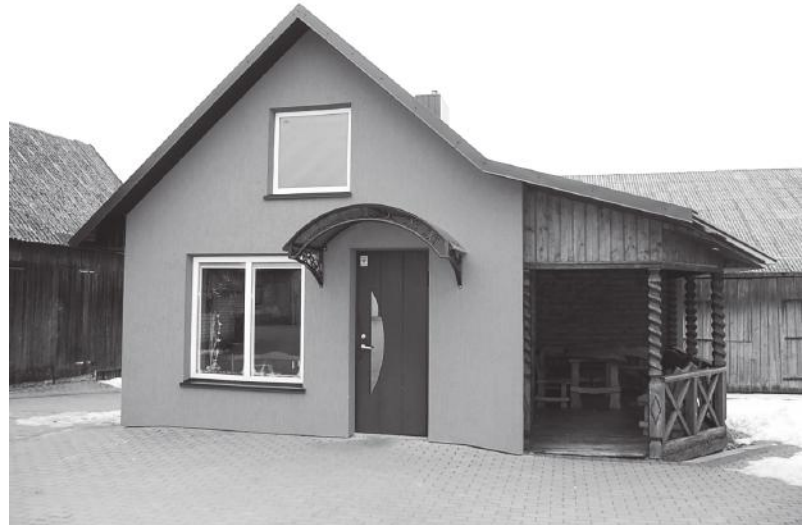
Daugiausiai ūkiniai sprendimai priimami modernioje lauko virtuvėje.