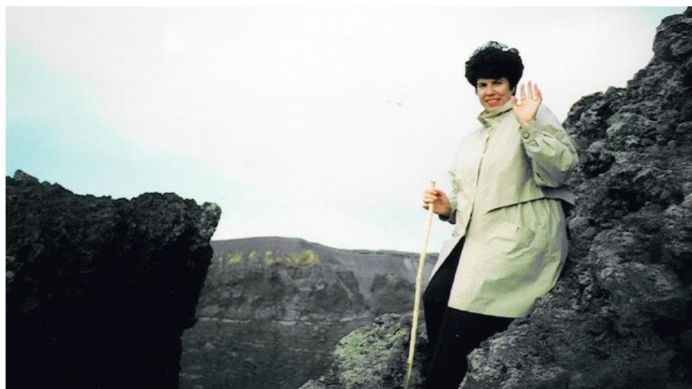
Išvykoje Italijoje, prie Vezuviujaus ugnikalnio.