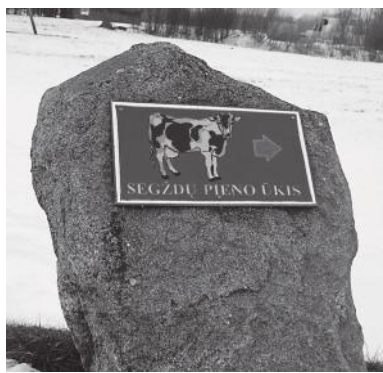
Šegždų akmuo, prie kurio sodiečiai Valstybės dieną užtraukia Lietuvos himną.