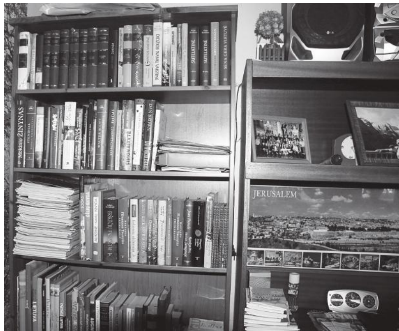
Šeiminkai — dideli knygų mėgėjai.