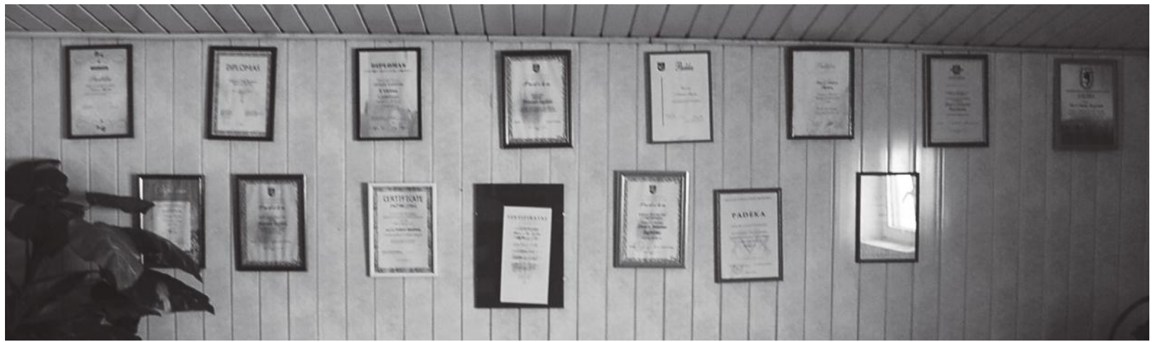
Fermos antrajame aukšte įrengtame kambaryje visa siena nukabinėta padėkos raštais.

Gyvenimas tekėjo į priekį. Ūkininkai dalyvavo Pieno ir Nitratų direktyvų programose. Taip iškilo 71 vieta nauja ferma su pieno linija, o veršeliai glaudžiasi senajai