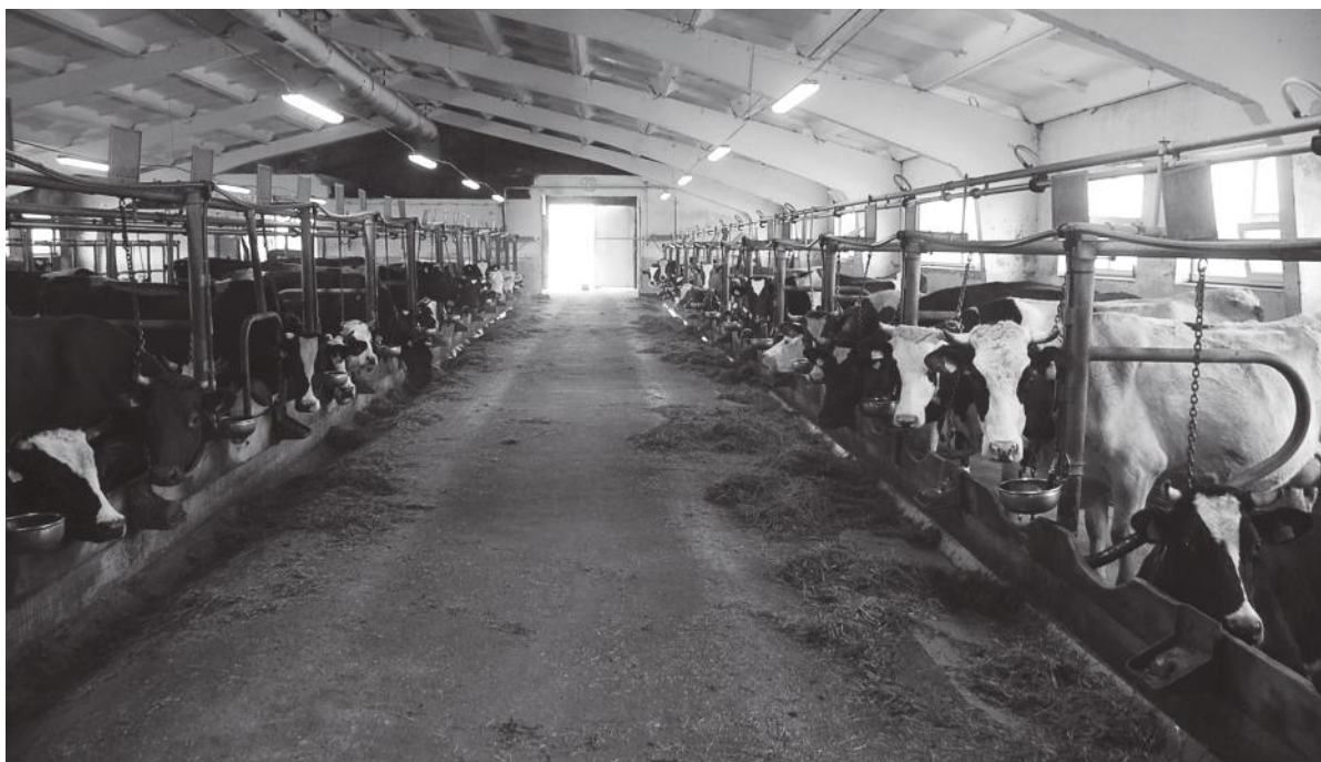
Tvarkingai prižiūrima ferma.