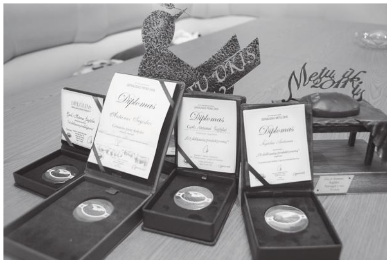
„Žemaitijos pieno“ bendrovės apdovanojimai ir „Metų ūkio“ prizai.

Pavasarij pranašauja čirškaujančių paukščių balsai, netruks atsikubėti ir liepos mėnuo su Valstybės diena. Ir vėl prie Šegždų akmens nuskambės Lietuvos valstybės himnas, traukiamas galingais sodiečių balsais. Palinkėkime, kad tų balsų nemažėtų, o prie jų nuolatos prisijungtų ir vaikiški balseliai.