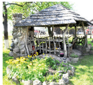
Gera atsikvėpti laisvą akimirką jaukioje pavėsinėje.