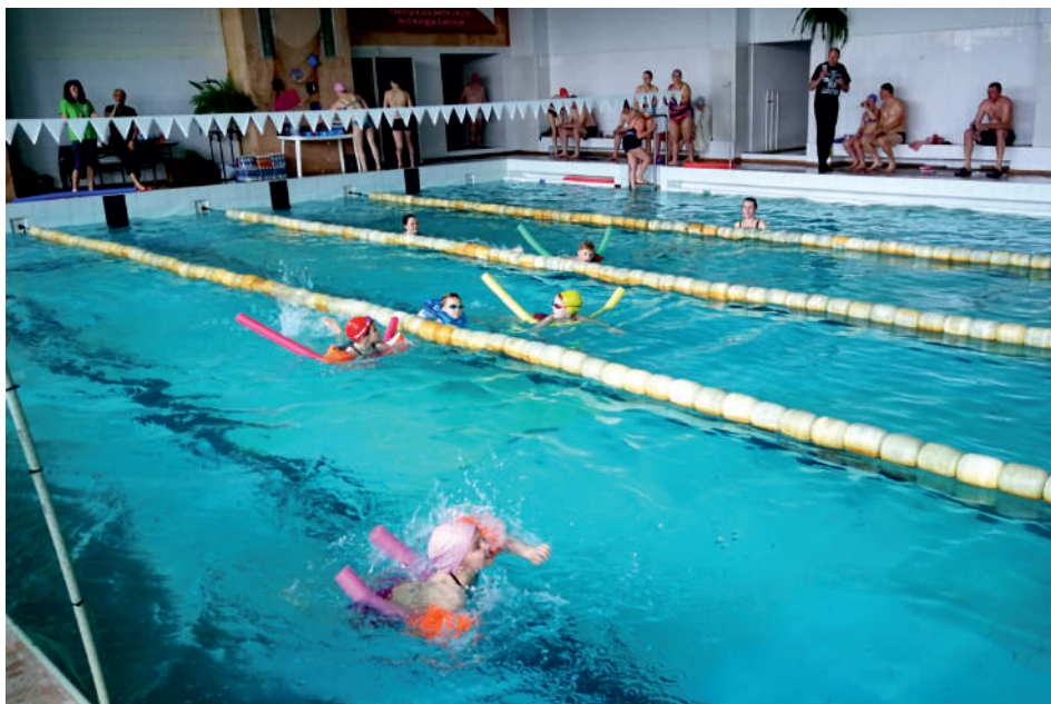
Vaikai dalyvavo smagių atrakcijų baseino.

Svarbiausia, kad šventės dalyviai lydėjo gera nuotaika, kurią dar labiau sustiprino pelnyti prizai, o ir gardžių užkandžių – glaistyto varškės sūrelių „Magija“, plėšomų sūrio dešrelių „Pik-Nik“, atsigaivinant mineraliniu vandeniu „Tichė“ ir gaiviaisiais gėrimais „Gaja“, netrūko.