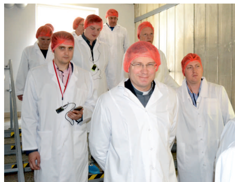
Komisijos nariai, lydimi įmonės specialistų, keliauja į gamybos cechus, kur gaminamas ir brandinamas kietasis sūris DŽIUGAS.

ir visiškai pasitiki atliktu darbu – nesibaiminama vertinti bet kurį sūrį. Paimta ir degustuota visų šešių brandinimų sūrio mėginių, įvertinant pagal klasikinius kriterijus – skonį, kvapą, spalvą, išvaizdą ir konsistenciją.