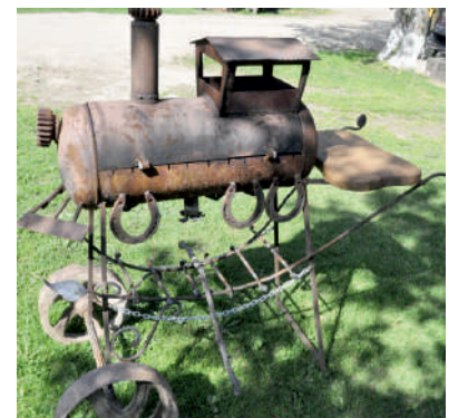
Išradingai sumeistruota šašlykinė.

Dabar mūsų sode — apie 20 obelių ir net 5 rūšių kriaušių“, — šypsodamasis pasakojo Antanas.