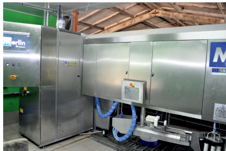
Fermoje sumontuoti melžimo robotai.

Jaukioje sodyboje, prie tvenkinio, galima ir atsikvėpti bei pasigėrėti vandenyje nardančiomis ir mitalo laukiančiomis žuvytėmis, o ant pavėsinės stogo žvilgsnį atkreipia nagingo meistro ten užkeltas medinis žiogas.