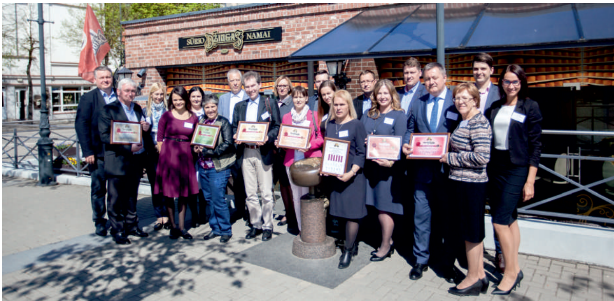
Vertinimo komisija su pasirašytais sūrio DŽIUGAS sertifikatais ir kitais garbiais svečiais prie sūrio DŽIUGAS namų Telšiuose.

Komisijos nariai, lydimi įmonės specialistų, keliavo į gamybos cechus, kur gaminamas ir brandinamas kietasis sūris DŽIUGAS. Jiems suteikta galimybė patiems išsirinkti mėginius ir išbandyti sūrininkų įrankius. Tai puikiausiai įrodo, kad įmonės technologai neabejoja gaminamo sūrio kokybe