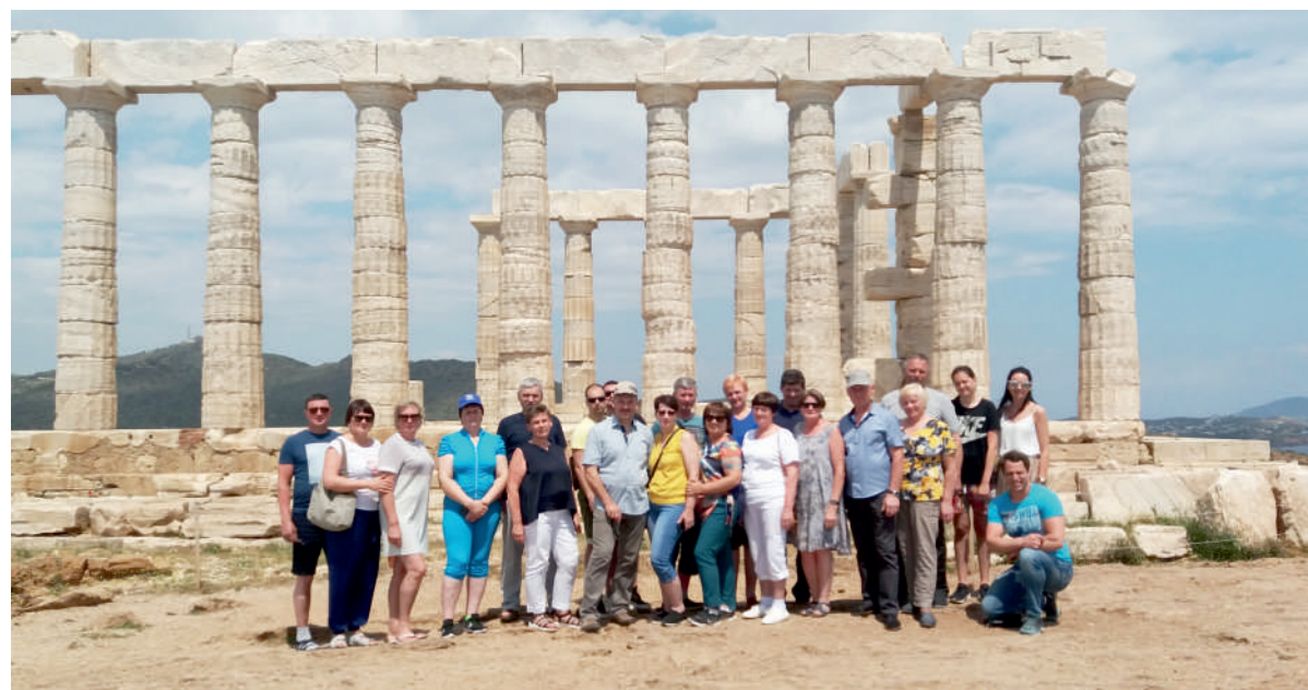
Geriausi praėjusių metų ūkininkai, bendradarbiaujantys su „Žemaitijos pieno“ įmone, gėrėjosi vieno seniausio pasaulio miestų Atėnų istorinėmis ir kultūrinėmis vietomis.

Legendinėje Graikijos sostinėje paliko kiek apsiniukęs dangus, bet į Lietuvą geriausi ūkininkai parvežė saulėtą savaitgalį – jie mielai dalinosi kelionės įspūdziais, negailėdami už puikią kelionę nuoširdžių padėkos žodžių „Žemaitijos pieno“ bendrovei.