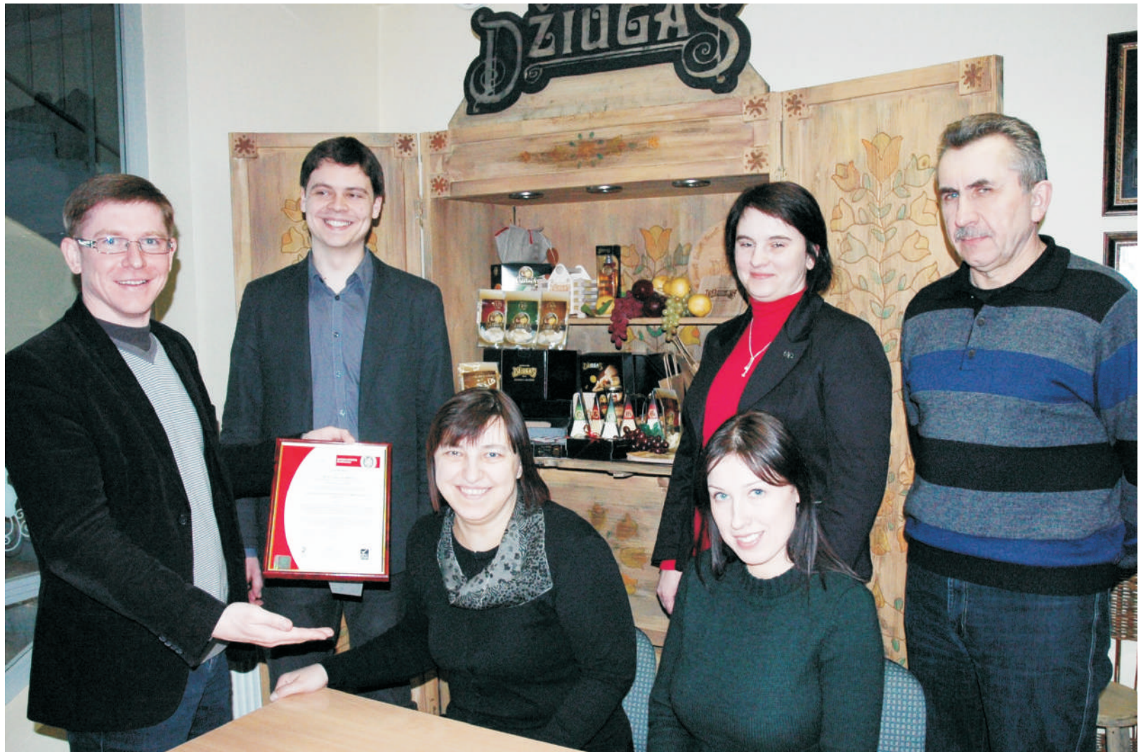
„Žemaitijos pieno“ darbuotojai džiaugiasi pelnytu įvertinimu.

„Žemaitijos pienas“ — pirmoji maisto gamybos įmonė Baltijos šalyse, pelniusi BRC A+ lygio sertifikatą. Šis, itin aukštas, visame pasaulyje pripažįstamas įvertinimas byloja, jog vienoje didžiausių ir moderniausių pieno perdirbimo įmonių Lietuvoje, iš anksto nepranešus, atliekami maisto saugos ir kokybės auditai. BRC reikalavimus atitinkanti kontrolės sistema įmonėje garantuoja gaminamų produktų saugumą, užtikrina, kad tiek Lietuvos, tiek užsienio vartotojus pasieks tik aukščiausios kokybės gaminiai.