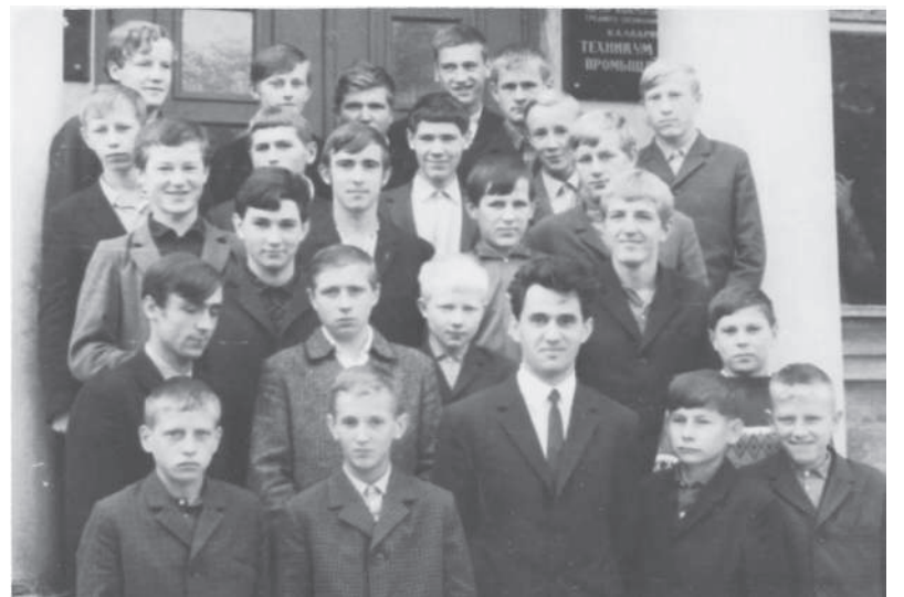
1969 m. rugsėjo 1 d. su Kalvarijos maisto pramonės technikumų pirmojo kurso auklėtiniais.

— Esu ir 118 mokslinių straipsnių autorius ir bendraautoris. Mano mokslinių interesų kryptys — visų pieno sudedamųjų dalių racionalus panaudojimas, pieno žaliavų ir gaminių kokybės gerinimas, pieno gaminių asortimento plėtimas, naujų technologijų taikymas. Didžioji dalis mano knygų skirta aukštųjų mokyklų studentams. Jas