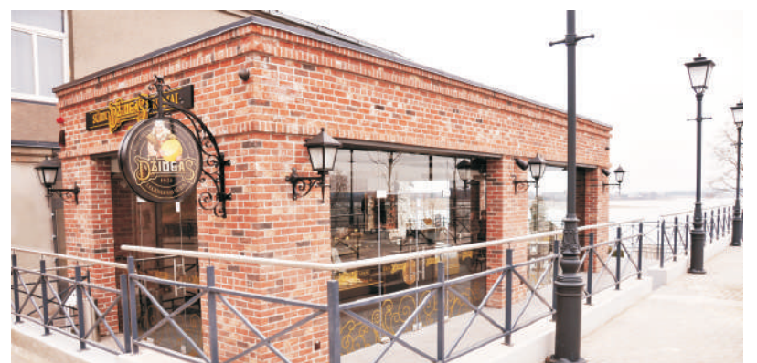
Nuostabi Masčio ežero panorama — prabangi ir nuolat kintanti interjero detalė...